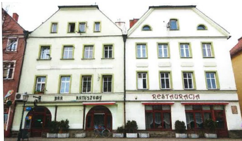
Widok elewacji frontowej – Rynek 13

na sprzedaż lokalu mieszkalnego Nr 2 znajdującego się w budynku położonym w Lubaniu przy ul. Rynek 13 wraz z udziałem we współwłasności nieruchomości gruntowej (działka nr 15, AM 3, Obręb III o powierzchni 505 m 2 , JG1L/00016287/0)