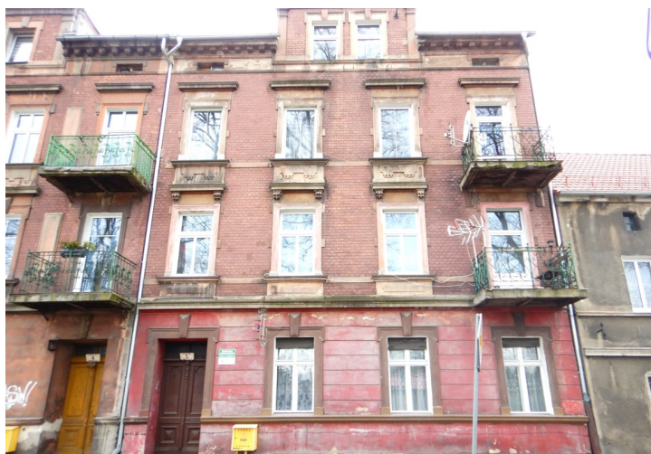
Ogólny widok budynku

na sprzedaż lokalu mieszkalnego Nr 4 znajdującego się w budynku położonym w Lubaniu przy ul. Granicznej 5 wraz z udziałem we współwłasności nieruchomości gruntowej (działka nr 79, AM 3, Obręb III o powierzchni 123 m 2 , JG1L/00017014/3)